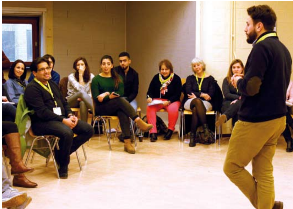
Photo © Laurence Côte - Atelier Radicalité, colloque Infor Santé "L'Ado, le décoder pour mieux l'accompagner". Bruxelles, le 31 janvier 2017.

De l'autre côté, des récits évoquent aussi le constat de jeunes mal dans leur peau, "résignés", qui n'osent même plus rêver l'avenir, et/ou comme englués dans les représentations qui leur collent à la peau. Lors des deux ateliers, les saynètes ima-