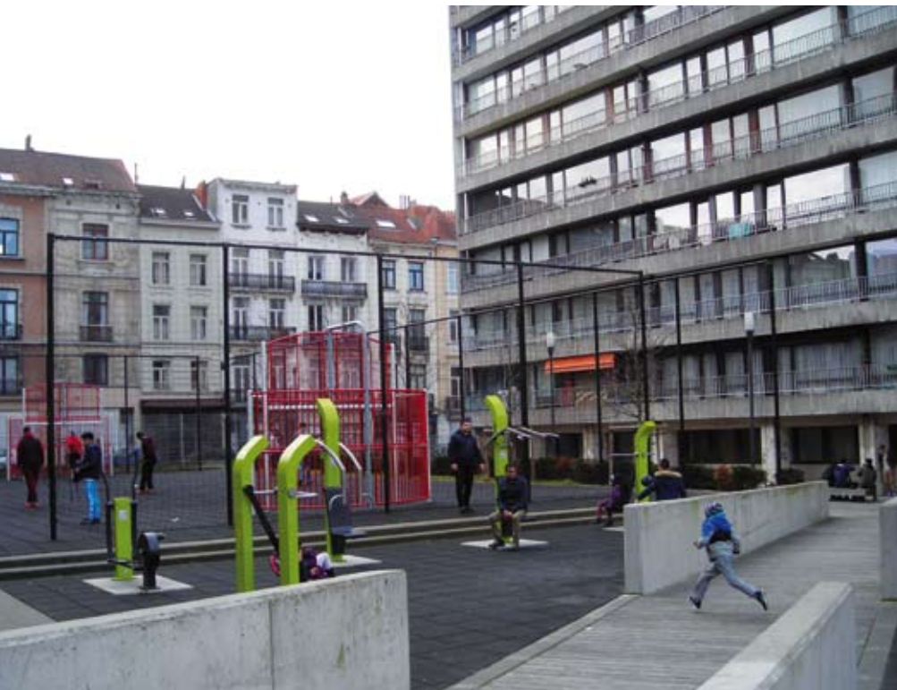
Terrain de sport et plaine de jeux, entre la rue de la Crèche et la rue Sans Soucis à Ixelles

pouvoir faire quelque chose que j'aime bien, qui fasse de mal à personne, et qui m'assure un certain niveau de vie. Si je travaille beaucoup, j'ai envie de pouvoir gagner pas trop peu. » Toutefois, ceci ne veut pas dire qu'il faille tout lui sacrifier : « Avoir une qualité de vie, avec du temps pour soi est essentiel. » Cela passe par « ne pas faire n'importe quoi » et « poser ses limites ». La nécessité de travailler ne doit pas pousser à accepter n'importe quel boulot, particulièrement si celui-ci ne correspond pas à sa personnalité. « Pour réussir dans la vie, il s'agit de trouver et de suivre sa propre voie (auto-réalisation) de manière autonome (auto-détermination). Ce n'est plus le social qui est premier, mais l'individu, pour le "meilleur" (épanouissement personnel) et pour le "pire" (incertitude, isolement, fragilité identitaire). » 11